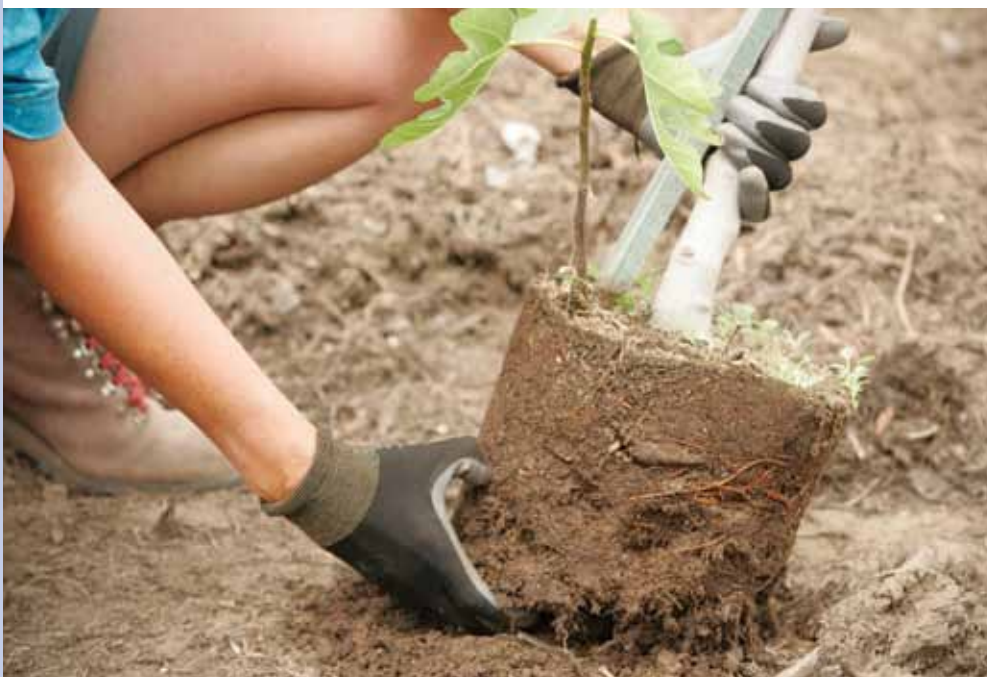
Un nuevo arbol que esta listo para ser plantado